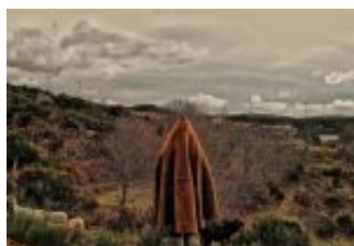
Porto e Norte